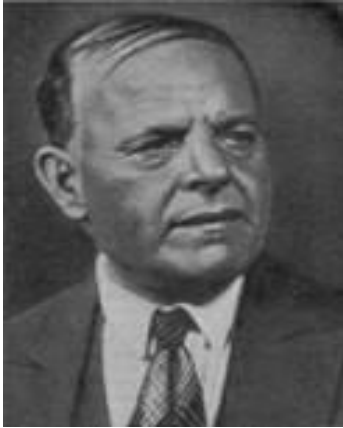
Jaim Najman Bialik

En este sentido se puede mencionar como parte de esta corriente al padre del hebreo moderno, Eliézer Ben Iehuda (1858-1922),